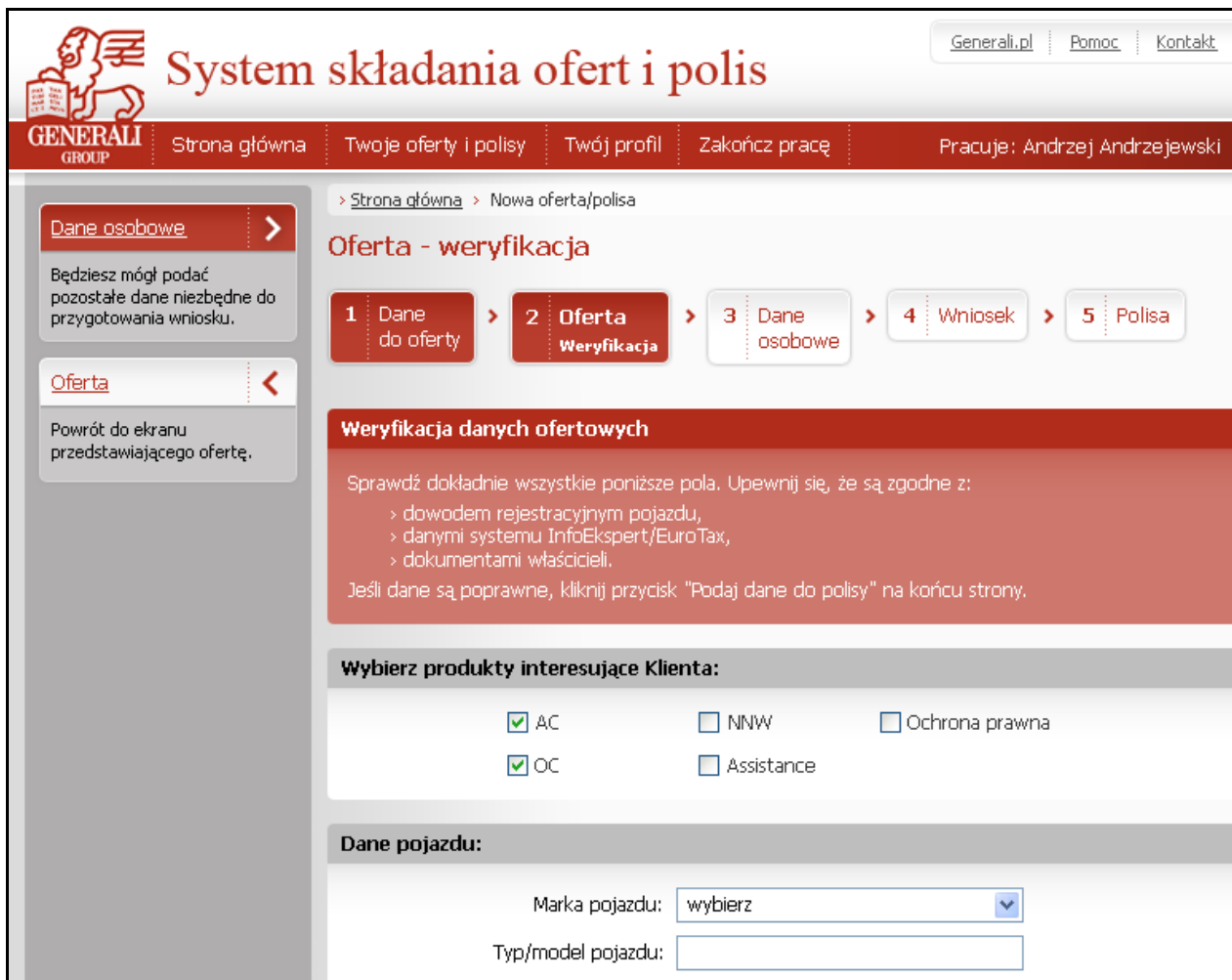
Rysunek 3. Projekt graficzny: weryfikacja wprowadzonych danych ofertowych

Wówczas, gdy zgodnie z harmonogramem zakończyliśmy naszą pracę, projekt został nam "zabrany" przez firmę wdrożeniową. Po mniej więcej miesiącu ujrzyliśmy wersję testową. Także ją poddaliśmy próbie, spotykając się już w Warszawie z kolejnymi agentami. Raport z badania działającego oprogramowania z konkretnymi wytycznymi poprawek przekazaliśmy Klientowi. To ostatnie badanie było podwójną weryfikacją: