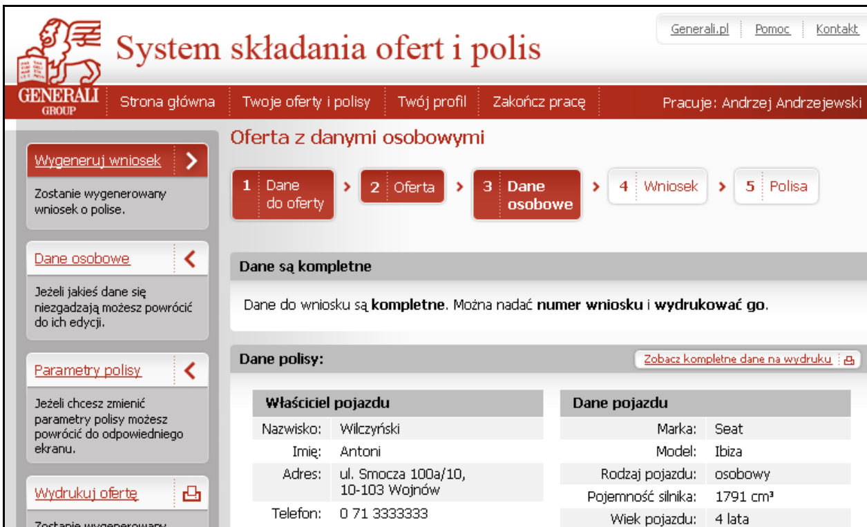
Rysunek 4. Projekt graficzny: prezentacja wprowadzonych danych przed wygenerowaniem wniosku

Co nie jest naszą zasługą, ale też świadczy o dobrym wyborze naszego Klienta - system webowy w porównaniu do oprogramowania innych towarzystw działającego pod Windows umożliwia tanie utrzymanie i aktualizacje (raz na centralnym serwerze zamiast comiesięczne wysyłki do agencji), a tworzenie oferty, wniosku i polisy to teraz kroki jednolitego procesu, zintegrowanego z dotychczas istniejącymi systemami wyceny i rejestracji polis komunikacyjnych.